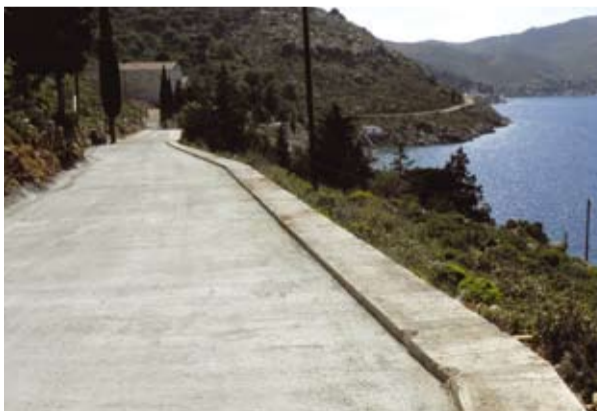
Ο δρόμος του Νημποριού

Το άλλο είναι η χρηματοδότηση με το ποσό των 470.000 ευρώ της κατασκευής του δρόμου στο Νημποριό, που όχι μόνο ταλαιπώρησε τόσα χρόνια τις εκάστοτε Δημοτικές Αρχές, αλλά δημιούργησε και προβλήματα μέχρι την τελευταία