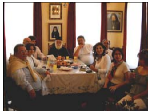
Η τούρκικη αντιπροσωπεία στον Πανορμίτη

Μετά τον Πανορμίτη, ο Δήμαρχος και ο αντιδήμαρχος θέλησαν να επισκεφθούν τις αφαλατώσεις, το κλειστό γυμναστήριο, το γήπεδο ποδοσφαίρου-στίβου και την υπό κατασκευή μαρίνα, έργα για τα οποία εξεδήλωσαν τον θαυμασμό τους στον Δήμαρχο Σύμης, καθότι τα έργα αυτά θα μπορούσαν να συμβάλουν στην περαιτέρω τουριστική-αθλητική και πολιτιστική ανάπτυξη των ενδιαφερομένων πλευρών.