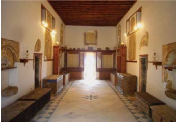
Η Σάλα του Χατζηγαπητού

Κατά τη διάρκεια των δεκαετιών 1970 και 1980 η Αρχαιολογική Υπηρεσία προχώρησε σε