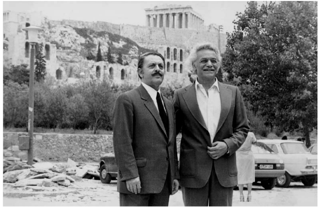
Ο Λάκης Σάντας (αριστερά) μαζί με το Μανώλη Γλέζο.

Εκείνη την εποχή, οι Γερμανοί άρχισαν την επίθεση στην Κρήτη, στις 20 Μαΐου 1941. Στην αρχή επιχειρήσαν διά θαλάσσης, αλλά ο αγγλικός πολεμικός στόλος, με πολλά πολεμικά πλοία και παρά τις απώλειες που είχε απ' τη γερμανική αεροπορία, βούλιαζε τα μικρά αποβατικά πλοία των Γερμανών και έτσι αυτοί είδαν ότι διά θαλάσσης δεν μπορούν, και αποφάσισαν να επιτεθούν στην Κρήτη από αέρος, με ειδικό σώμα αλεξιπτωτιστών, το οποίο είχαν εκπαιδεύσει ειδικά, αλλά και με καταγιστικούς βομβαρδισμούς με τα βομβαρδιστικά τους αεροπλάνα.