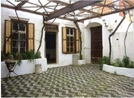
Αύλιος χώρος του μουσειακού συγκροτήματος

Ενδιαφέρον παρουσιάζει η Έκθεση Συλλογής Προϊστορικών και Κλασικών Αρχαιοτήτων όσον αφορά στην αντίληψη παρουσίασης των εκθεμάτων κατά συλλογές ξεφεύγοντας από το στερεότυπο τρόπο της μέχρι σήμερα έκθεσης, γεγονός που επισημάνθηκε ιδιαίτερα από τα μέλη του Συμβουλίου. Το κτίριο που θα φιλοξενηθεί η προαναφερόμενη συλλογή, βρίσκεται στο ενδιαμέσο επίπεδο, μεταξύ του Αρχοντικού Φαρμακίδη και της Σάλας του Χατζηγαλητού. Το ίδιο το κτίριο είναι ανακατασκευη προϋπάρχουσα κατοικίας με σύγχρονη προσθήκη που