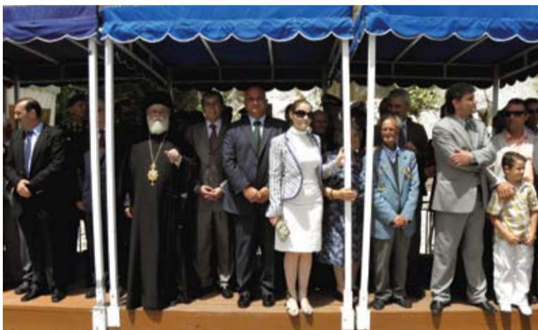
Λίγα λεπτά πριν την έναρξη της παρέλασης

Στη διάρκεια του γεύματος τρία άτομα εισήλθαν στην αίθουσα και μοίρασαν γραπτή διαμαρτυρία στους παρευρισκόμενους. Η ενέργεια αυτή, από καταγγελία που λάβαμε, εκνεύρισε τους ιδιοκτήτες της αίθουσας, οι οποίοι –όπως μαθαίνουμε- έχουν σκοπό να αντιδράσουν για παραβίαση ιδιωτικού χώρου εφ' όσον είχαν δοθεί προσκλήσεις.